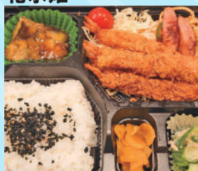
エビフライ弁当 700 円