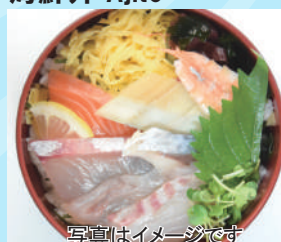
写真はイメージです 日替り海鮮丼く上 800 円