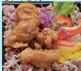
長州鶏の照り照り丼ぶり 600 円