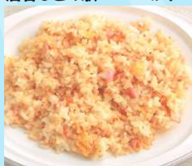
うにピラフ 600 円