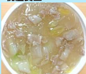
肉飯 600 円