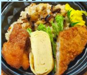
サザエ釜めし弁当 700 円