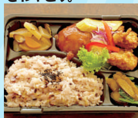
さわやどりのお弁当 700 円