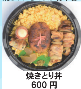
焼きとり丼 600 円