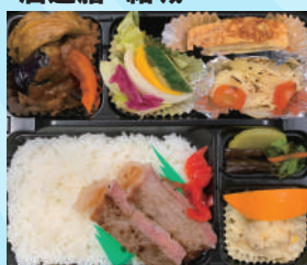
牛ステーキ弁当 800 円