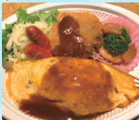
ミニオム串 700 円