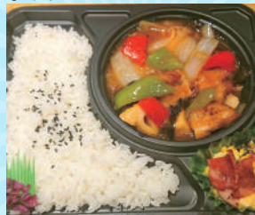
酢豚弁当 800 円