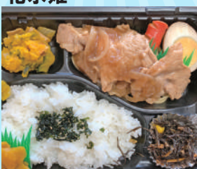
生姜焼き弁当 700 円