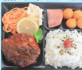
ジャンボハンバーグ弁当 800 円