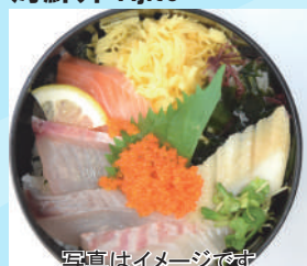
写真はイメージです 日替りサービス海鮮丼 500 円